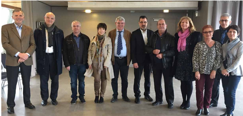
Le Président et les 10 Vice-Présidents de la communauté d'agglomération

Elle est issue de la fusion de deux communautés Pays de Fontainebleau et Entre Seine et Forêt et d'une extension à dix-huit communes issues de trois autres communautés Pays de Bière, Pays de Seine, Terres du Gâtinais.