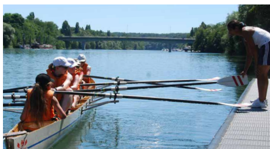
Des stages d'aviron destinés au 9-16 ans sont organisés pendant les vacances de juillet