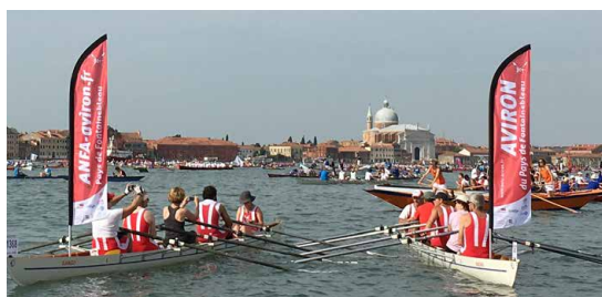
Cinq bateaux de la section loisirs ont porté les couleurs de l'ANFA à la 43 e Régate de la Vogalonga à Venise