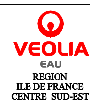
PLANCHE N° : P1/P3

AGENCE DE FONTAINEBLEAU 47 bis, rue GUERIN 77300 FONTAINEBLEAU TEL : 01-60-39-55-98 FAX : 01-64-22-75-75