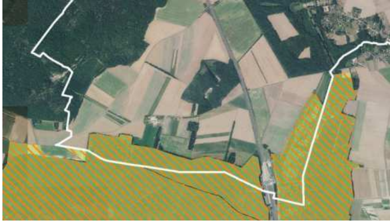
1 - Sites Natura 2000 : en bistre