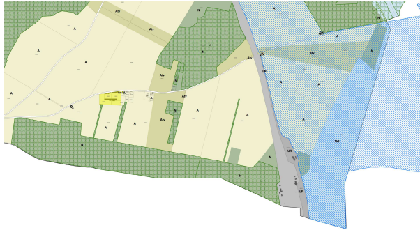
2 – extrait du plan de zonage