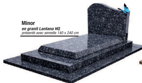
Minor en granit Lantana HQ présenté avec semelle 140 x 240 cm