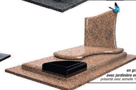
Ceric en granit Jelena avec jardinière en Hellebore présenté avec semelle 140 x 240 cm

* Remise effectuée pour toute commande ferme d'un monument passée entre le 10/03/2018 et le 31/05/2018 inclus, dans une des agences Santilly - Le Choix Funéraire. Cette remise s'applique à toute commande de 3 000 € TTC minimum (avant remise) incluant au moins l'achat d'un monument funéraire. N'entrent pas dans le calcul du montant de la commande offrant droit à la remise, les prestations suivantes : la semelle, la pose, la gravure, les travaux, les éventuels suppléments locaux (taxe ou autres)... Offre non cumulable avec d'autres offres en cours. Attention, chaque cimetière possède ses traditions ou son règlement. La présence d'une semelle peut ne pas être autorisée et la pose varie selon la nature du terrain et des difficultés de chaque cimetière. Visuels non contractuels.