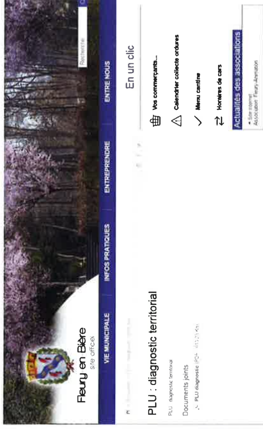
Capture d'écran de la page « PLU » du site Internet de la Mairie.