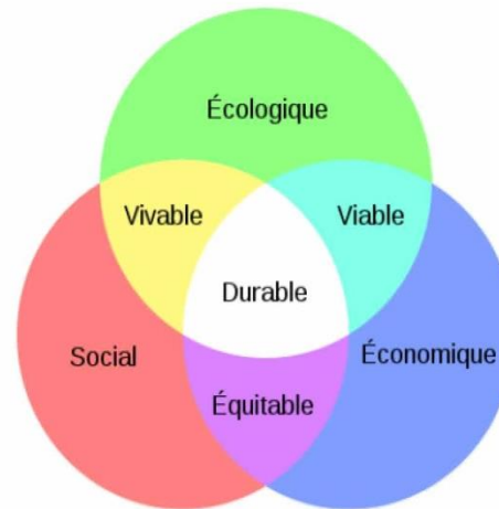
Les trois piliers du développement durable

Le contenu du Projet d'Aménagement et de Développement Durables (PADD) est défini par l'article L 151-5 du code de l'urbanisme. [2] .