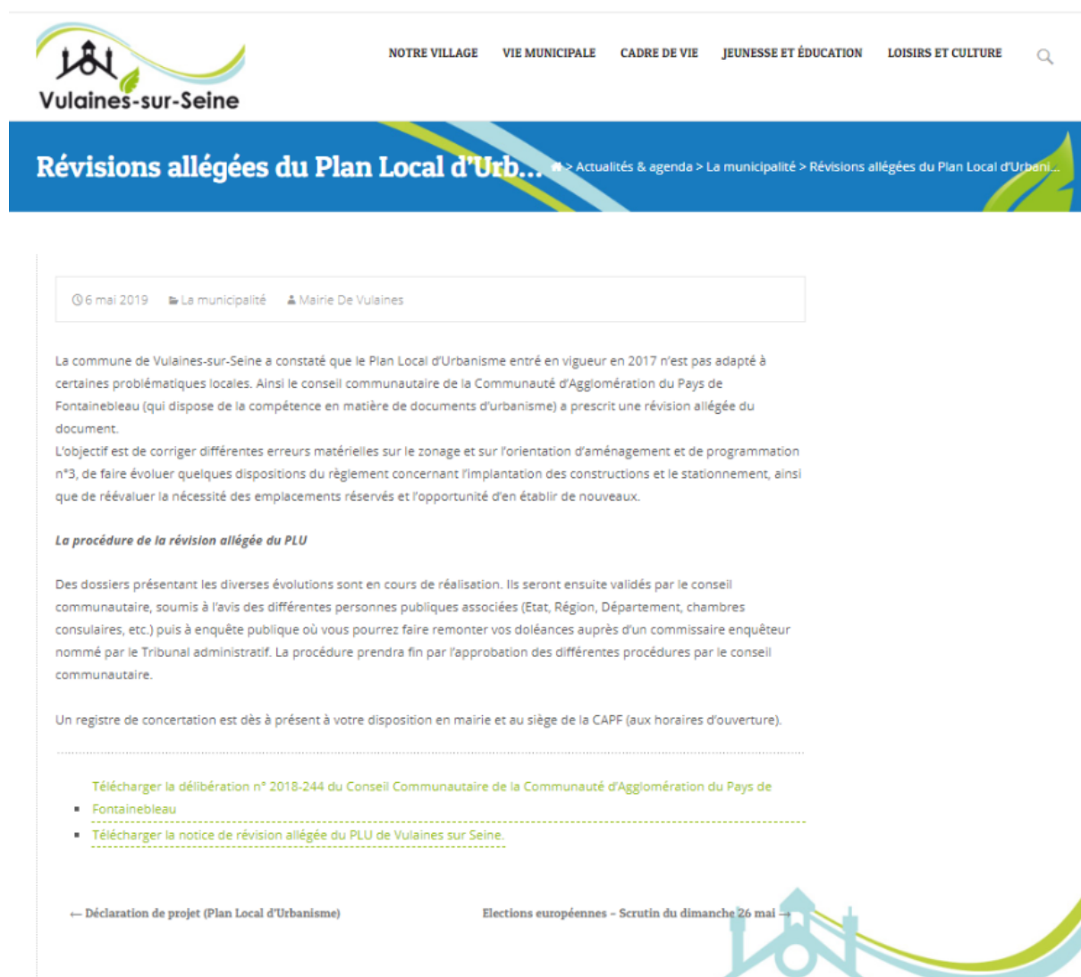
Figure 1 : Article sur la procédure et mise à disposition de la notice sur le site internet de la commune