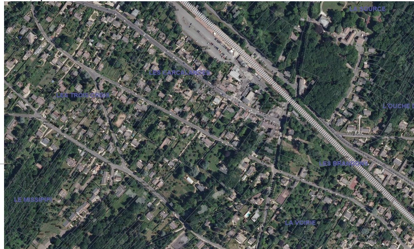
Extrait de la présentation de la réunion publique du 30 janvier 2020