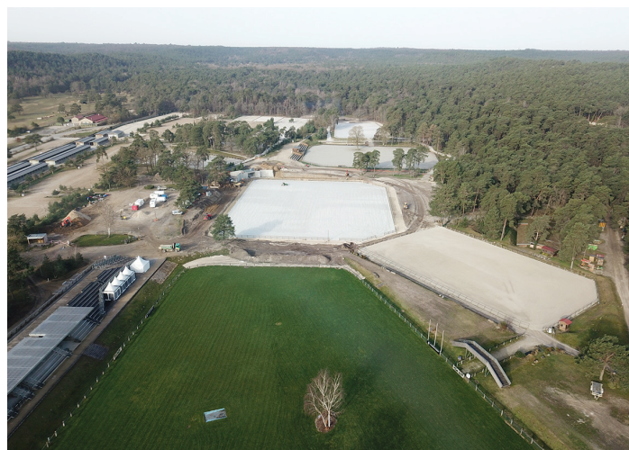
Vue aérienne des carrières depuis le terrain d'honneur.

Le site du Grand Parquet sera prêt pour la saison 2021 et accueillera de nombreux événements.