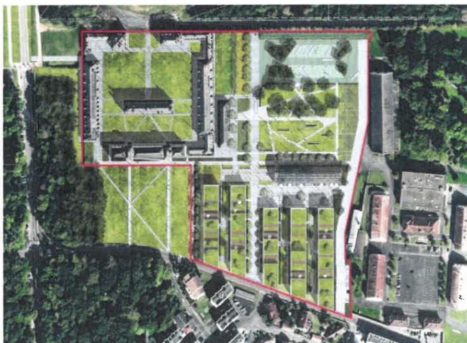
Vue aérienne du projet

Le projet prévoit la réhabilitation du quartier des Héronnières (10557 m 2 de surface de plancher) dédié aux bâtiments d'enseignement tandis que le terrain limitrophe du Clos des Ebats sera divisé en deux : au Nord un jardin paysager dédié aux arts ainsi qu'un parking autocars et au Sud des bâtiments d'hébergements étudiants (22 800 m 2 ) et de services liés au campus étudiant. L'ancienne halle militaire (1500 m 2 ) sur le Clos des Ebats sera préservée et transformée en lieu de vie et d'activités artistiques ouvert sur la ville et le territoire.