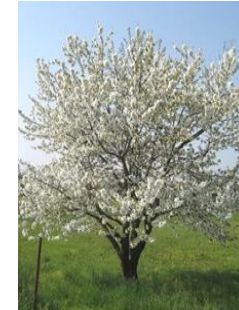
Merisier en fleurs