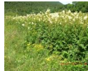
Reine des prés