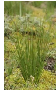
Jonc ( Juncus effusus )

Massette à feuilles étroites ( Typha angustifolia ) Massette à feuilles larges ( Typha latifolia ) Menthe à feuilles rondes ( Mentha suaveolens ) Menthe aquatique ( Mentha aquatica ) Menthe des champs ( Mentha arvensis ) Myosotis des marais ( Myosotis palustris ) Populage des marais ( Caltha palustris ) Reine des Prés ( Filipendula ulmaria ) Renouée amphibie ( Polygonum amphibium ) Roseau commun ( Phragmites communis ) Rubanier rameux ( Sparganium erectum ) Sagittaire ( Sagittaria latifolia ) Salicaire ( Lythrum salicaria ) Scirpe des marais ( Eleocharis palustris ) Veronique mouron d'eau ( Veronica angaliis-aquatica )