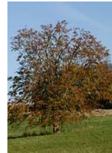
Noyer commun