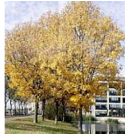
Frêne commun

Saule blanc ( Salix alba ) Saule cendré ( Salix cinerea ) Saule à oreillettes ( Salix aurita ) Saule à trois étamines ( Salix trianda ) Saule fragile ( Salix fragilis ) Saule pourpre ( Salix purpurea ) Sureau noir ( Sambucus nigra ) Tremble ( Populus tremula )