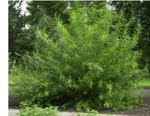
Saule des vanniers