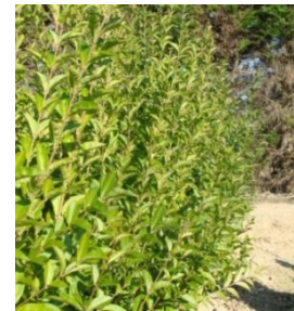
Troène commun