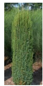
Genévrier commun