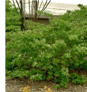
Caramésier à balais