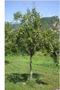
Poirier sauvage