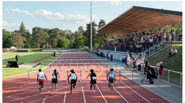
Meeting d'athlétisme – Stade P. Mahut

Si le stade a su accueillir un large public dans ses tribunes et abords, il a également été l'objet de la visite de délégations sportives étrangères, venues en reconnaissance des sites de l'agglomération figurant au catalogue des Centres de Préparation aux Jeux Olympiques.