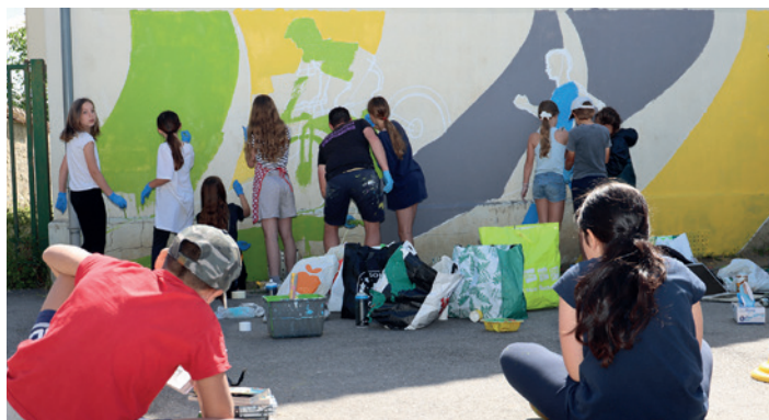
Graph, cour d'école de Recloses

L'ensemble des groupes scolaires, collèges et accueils de loisirs sont sollicités pour participer à la réalisation de fresques olympiques aux côtés du service jeunesse de l'agglomération. Les cours d'école ou encore les murs de bâtiments communaux accueillent les disciplines olympiques pour célébrer l'arrivée des Jeux de Paris 2024. Certaines communes font le choix de disciplines valorisant leurs habitants émérites : l'équitation pour Roger-Yves Bost à Saint-Martin-en-Bière et le plongeon pour Benjamin Auffret à Perthes.