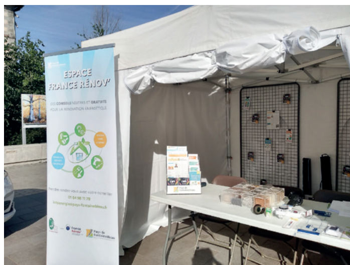
Stand France Rénov' aux Naturiales

En mai dernier, les services de l'agglomération et les conseillers France Rénov' sont venus à votre rencontre sur un stand lors des Naturiales de Fontainebleau. Fort de ce succès, l'expérience sera renouvelée sur divers événements publics en lien avec l'environnement et les services à l'habitant.