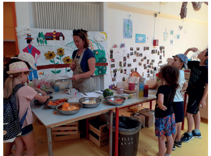
Journée de clôture – atelier cuisine

Un grand merci aux différents partenaires de ce projet, animé par les services économie et enfance jeunesse de l'agglomération, sans qui rien n'aurait été possible : L'Association 1001 SILLONS, les agriculteurs et exploitants locaux qui ont reçu les enfants sur leurs terres.