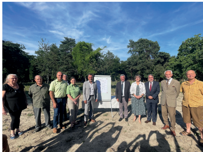
Signature de la Charte – juillet 2022

Sur le volet curatif, plus de 300 tonnes de dépôts sauvages ont été collectés depuis 2018 par le SMICTOM de la région de Fontainebleau, grâce à un renfort opérationnel en faveur de l'ONF et l'intervention d'un camion grappin pour le ramassage des tas en forêt. Les communes, qui ne disposent pas des moyens techniques ou humains pour collecter les déchets en lisière et se rendre en déchèterie, ont pu également bénéficier de ce dispositif.