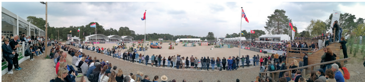
Championnat de France Saut d'obstacles – avril 2022

Cette saison aura marqué un tournant pour le Grand Parquet. L'agglomération a déjà engagé trois périodes annuelles de travaux qui lui auront permis depuis 2018 de voir toujours plus grand. Il est aujourd'hui doté de carrières olympiques et d'infrastructures de qualité. Les manifestations ont toutes connu un franc succès auprès du public venu nombreux en connaisseur ou en découverte du monde des compétitions équestres.