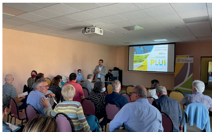
Comité de pilotage à la Chapelle-la-Reine

Des réunions et ateliers élus nourriront dès la rentrée l'élaboration du Projet d'Aménagement et de Développement Durable (PADD). Ce document constitue la clef de voûte du PLUi en définissant les orientations générales d'urbanisme et d'aménagement pour formaliser un projet commun et solidaire pour le territoire. Cette étape s'achèvera par un débat en conseil municipal et communautaire au premier semestre 2023.