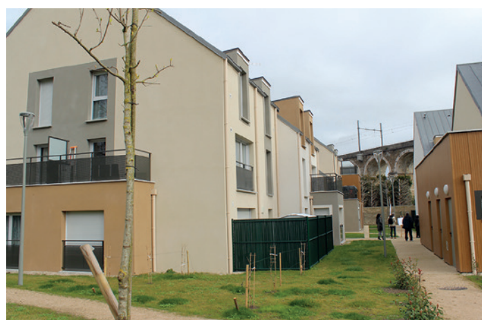
Résidence du Viaduc à Avon

7 bailleurs sociaux sont présents sur le territoire pour un total de 2 737 logements répartis sur 13 communes du territoire.