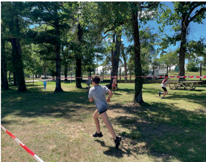
Épreuve de course à pied - parc de la piscine

et individuelles. Selon une organisation millimétrée, 500 élèves se sont succédés pour effectuer un parcours de 100 m nage libre et 1 000 m de course à pied autour de la piscine. Un grand bravo à tous les jeunes pour leurs performances sportives !