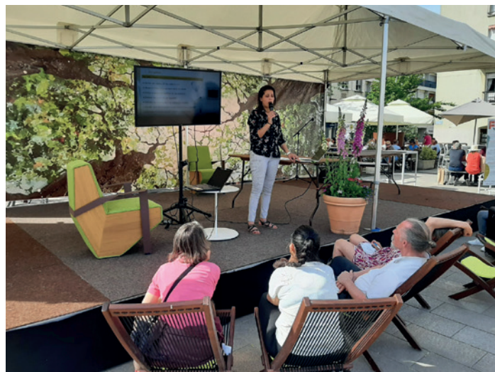
Conférence rénovation énergétique par le PnrGf aux Naturiales

Ces permanences rencontrent un franc succès et plus de 70 personnes ont pu être reçues depuis le début d'année. En 2021, 77 dossiers instruits ont débouché sur 31 chantiers en cours ou achevés, 26 en programmation et 20 sont différés.