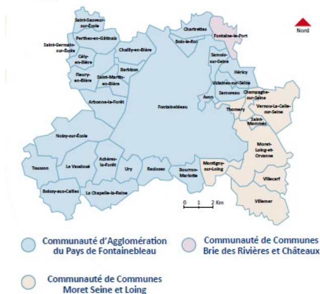
Cartographie du territoire du SMICTOM | .....

- la communauté de communes Bries des Rivières et Châteaux pour la seule commune de Fontaine-le-Port.